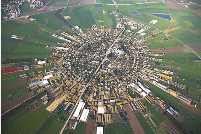
Un Kibutz in Israel, ver communitate economic.