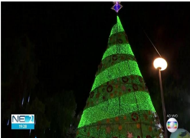
Arbore de Natal in Laguna R. Freitas, in Rio

NOVAS Notícias Nouvelles Notizie News Novosti Nyheter Nachrichten Noticias Notícies HOBOCTH