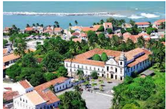
Olinda in le Stato Pernambuco, fundate in 1537.